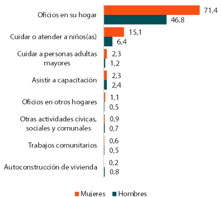
Gráfico 1. Participación porcentual en actividades no remuneradas, según sexo y tipo de actividad. Bogotá, 2017